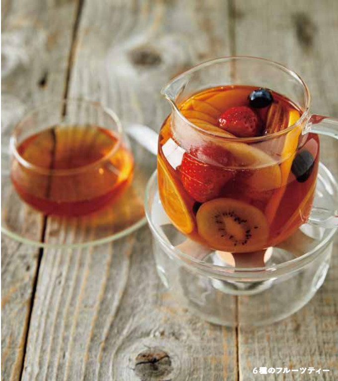
6種のフルーツティー